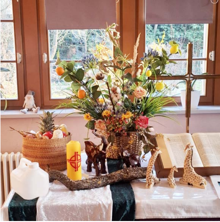
Der Altar im Gemeinderaum war mit für Nigeria typischen Sachen geschmückt.