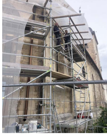
Die Fenster sind eingerüstet.