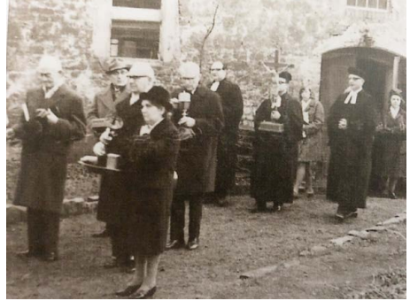
Aufnahme vom 01.12.1968 nach dem letzten Gottesdienst

Das Birkenwäldchen in Zöbigger wurde in den 80er Jahren des 19. Jahrhunderts angelegt. In ihm befand sich eine Ziegeleianlage mit Trockenschuppen.