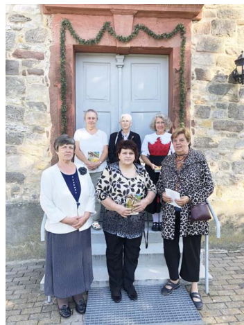
Goldene Konfirmation im September Kirche Oechlitz